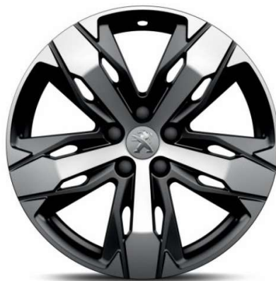
LOS ANGELES 18" Allure Pack /GT